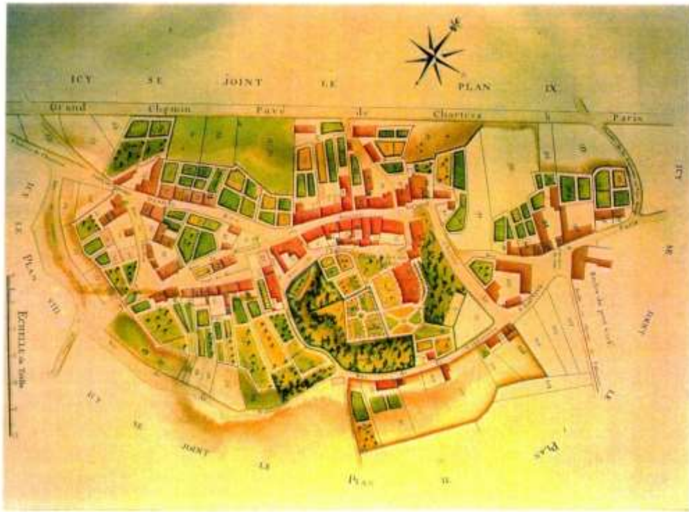
Plan terrier de GOMETZ-LE-CHATEL, 1774.

L'Historien Jules LAIR cite dans Histoire de la Seigneurie de Bures 1876