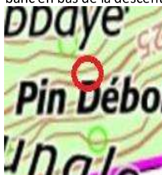
114 : Coude dans la descente