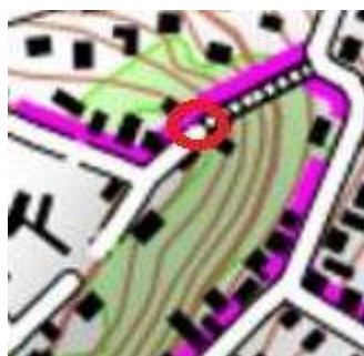
108 : Haut de l'escalier Froehlich