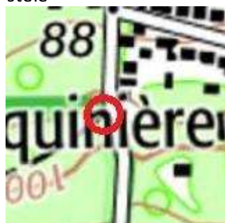
110 : Jonction de chemin, banc en bas de la descente