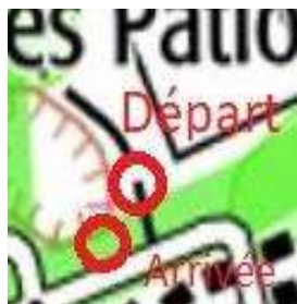
D : abri joueur A : parking voiture

L'emplacement des différentes balises est indiqué sur les vignettes ci-dessous. Une brève définition accompagne chaque vignette. Tous les chemins ne sont représentés sur la carte. Les balises sont généralement à proximité immédiate d'un chemin ou d'un sentier, sauf indication expresse. Le parcours peut se faire dans l'ordre que vous souhaitez. Le temps maxi est indiqué dans la fiche de paramétrage.