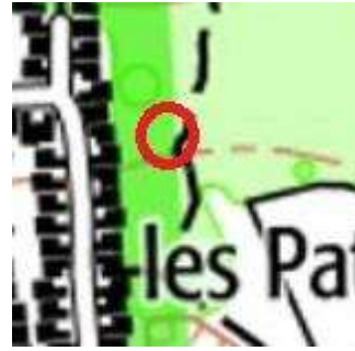
118 : Traversée de clôture