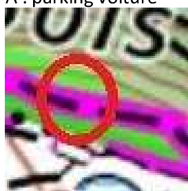
104 : Passerelle