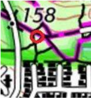
116 : On y joue de la musique