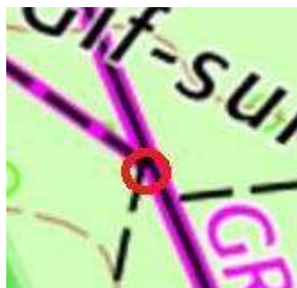
101 : Intersection de chemins