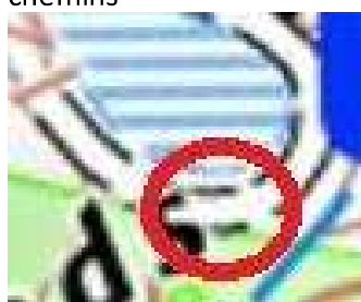
105 : Banc