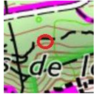
119 : Chemin de traverse au nord de la stèle