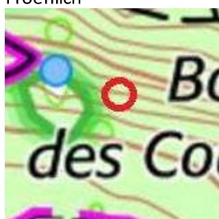
112 : Coude de chemin (à l'Est des réservoirs)