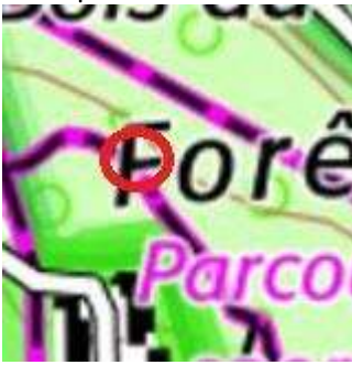
120 : Chêne sessile