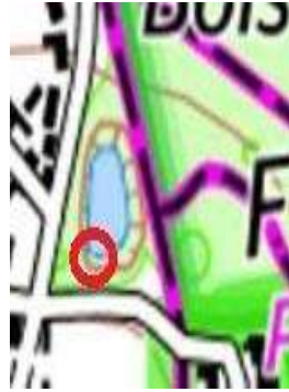
117 : Au sud de la mare