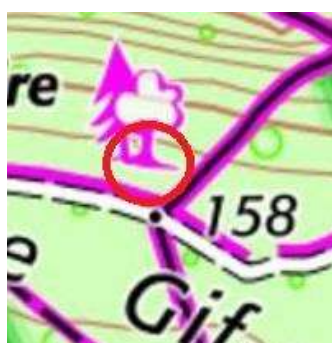
113 : Pin le plus célèbre du plateau