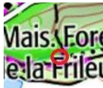
103 : Entre le bas de descente et la rivière