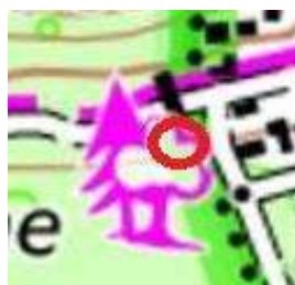
109 : Chêne remarquable