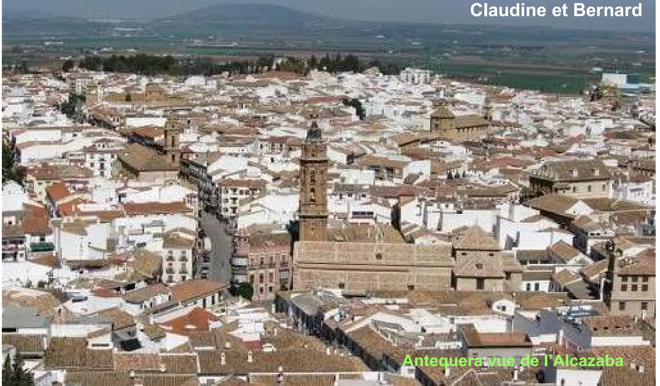
Antequera vue de l'Alcazaba